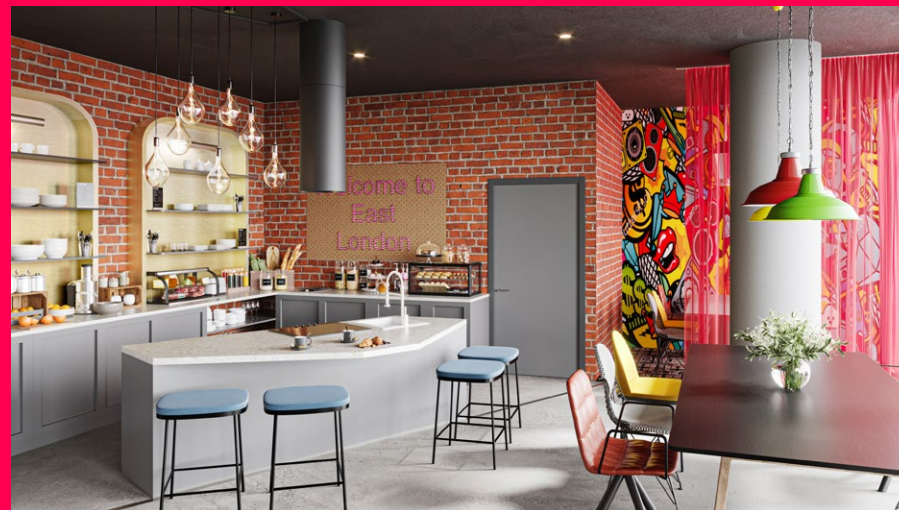
L'Adagio Original London – Whitechapel