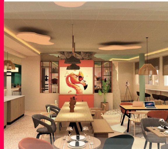
L'Adagio Original Porte de Camargue