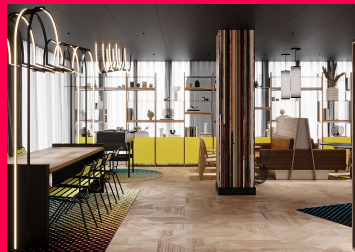
L'Adagio Access Rouen – Centre