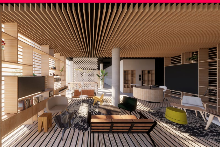
L'Adagio Original Heidelberg