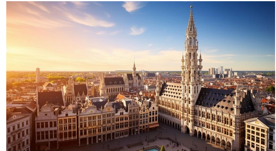
L'Adagio Access Brussels – Airport

5 projets de rénovation sont également prévus afin de garantir à l'ensemble des clients cohérence, montée en gamme, amélioration de la qualité, ainsi qu'une expérience client pratique et moderne, le tout en revendiquant un parti-pris design fort, inspiré par la culture locale des destinations.